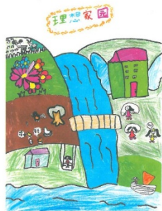
广州市白云区京溪小学 指导老师:李兵 二年(8)班 贾婷茜

在山坡底下的小河上有一条小船慢慢的划回来,那是小红的妈妈去打鱼回来了。这是我们的理想家园,我们每天都在这个地方开开心心的生活着。