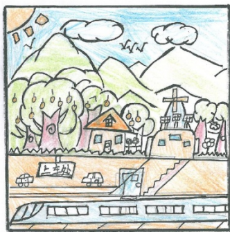
广州市白云区京溪小学 四年（1）班 李睿祺

我心中的理想家园是个充满和谐和幻想的地方！它分为两层，第一层是川流不息的繁华都市，这里的道路畅通无阻，汽车变成了靠太阳能行驶的环保车，可释放出清新的空气。地底下是智能地铁站，铁路像一个大蜘蛛网一样遍布全球。只要输入目的地，便可在几分钟之内到达想去的地方。第二层是适合居住、山清水秀的世外桃源。这里禁止行车，房屋就像变形金刚，可以根据人们所需的条件而变化，屋内冬暖夏凉，屋外鸟语花香。人们尽情地在世外桃源中散步、娱乐；吃着最新鲜的无公害蔬果，享受着无忧无虑的生活。希望我的梦能够早日实现！