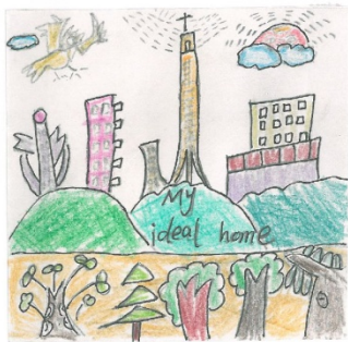
广州市白云区京溪小学 三年（4）班 张淏霖